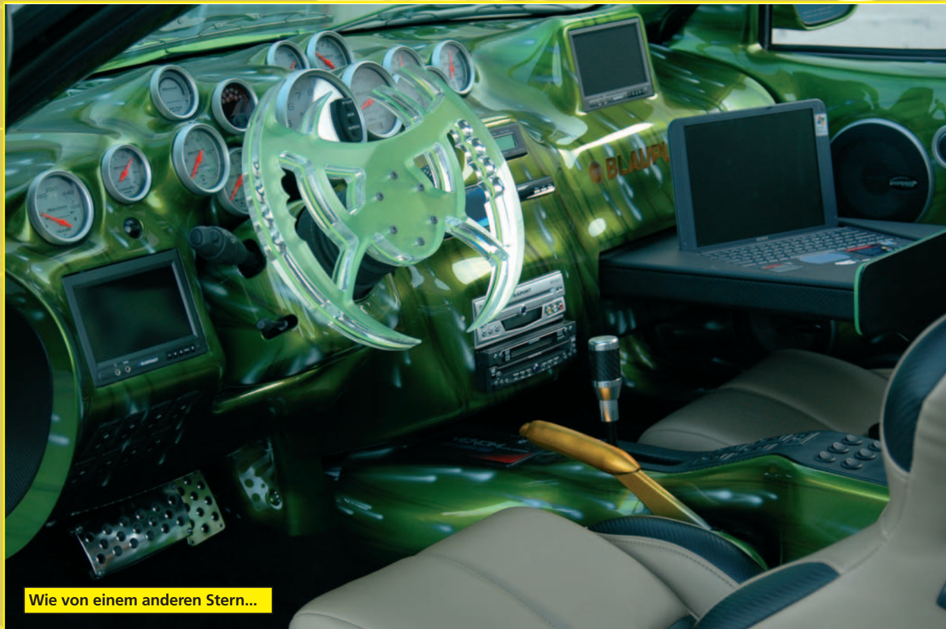
Wie von einem anderen Stern...