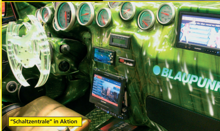
"Schaltzentrale" in Aktion