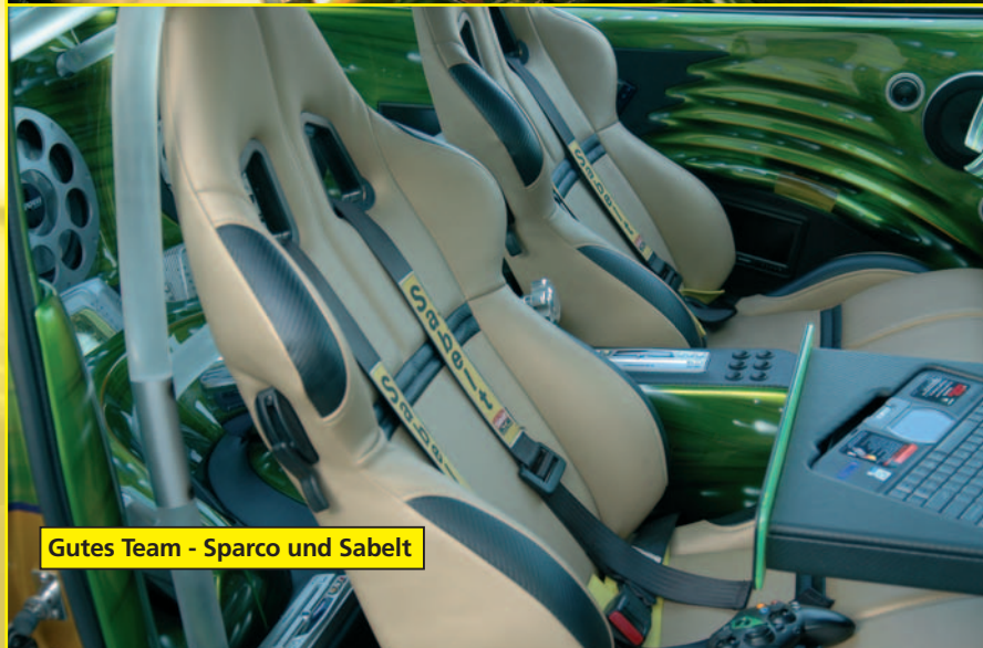
Gutes Team - Sparco und Sabelt

Der blaue Punkt des Sponsors ist überall zu sehen. Sämtliche Audio- und Videosysteme stammen von diesem Hersteller der dieses Markenzeichen benutzt. So findet sich ein Chicago-DVD-Flip-out-Monitor im Armaturenbrett. Im Auto sind vier DVD-Player verteilt und ein DX-N Navigationssystem sowie 28! Bildschirme verbaut. Dementsprechend werden auch fünf Videoswitch-Systeme (Blaupunkt IVSC-5501) benötigt. „Nur“ vier 12-Zoll-Overdrive-Flat-Subwoofer paßten in die Rückwand. Sechs versenkbare Verstärker (3 pa4100 und 3 pa2150) geben die Musik weiter an die Lautsprecher, von denen auch fünf Zweiwege-Sets in den Türen, im Koffer- und im Motorraum verbaut wurden.