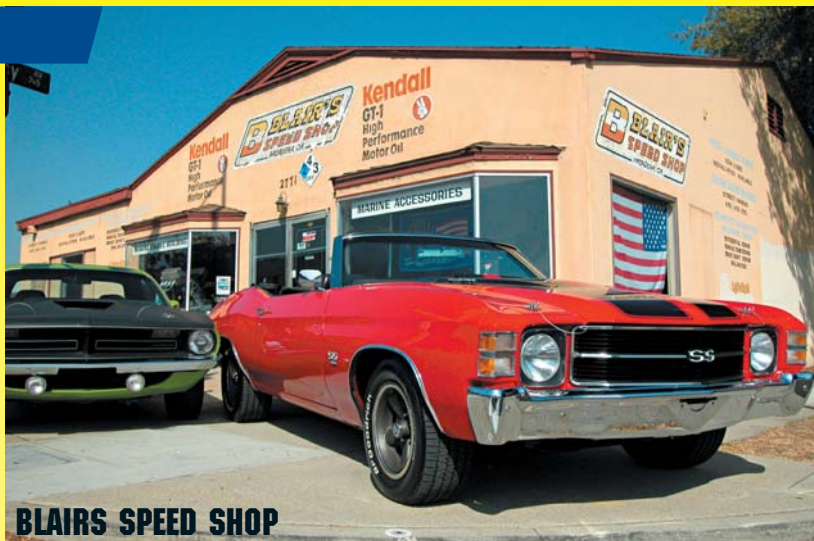
BLAIRS SPEED SHOP