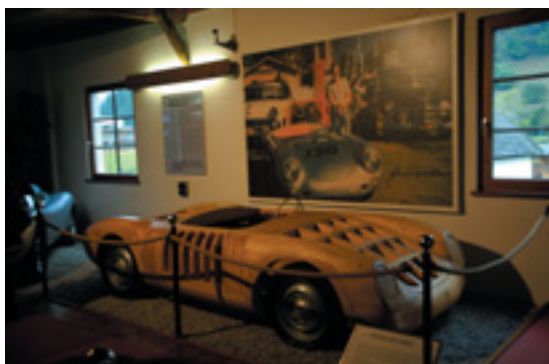
PORSCHE AUTOMUSEUM, GMUND