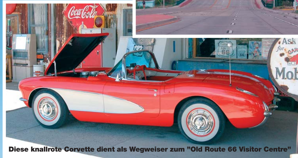
Diese knallrote Corvette dient als Wegweiser zum "Old Route 66 Visitor Centre"