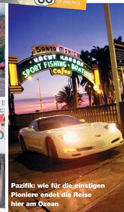
Pazifik: wie für die einstigen Pioniere endet die Reise hier am Ozean