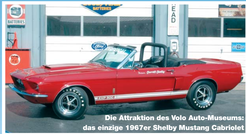
Die Attraktion des Volo Auto-Museums: das einzige 1967er Shelby Mustang Cabriolet

Rolla, inmitten von Missouri gelegen, bietet sich als Quartier für die erste Nacht an. Widerstehen Sie der Verlockung weiterzufahren – den Spirit der Route 66 erlebt man besser cruisend statt rasend. Rolla bietet nicht nur "Route 66