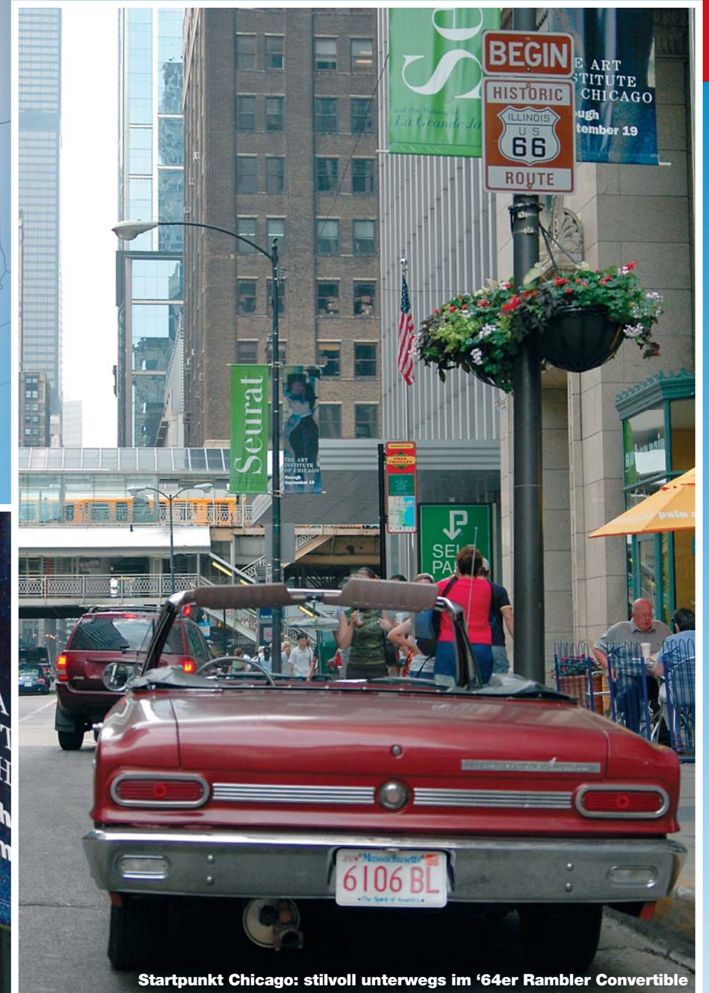
Startpunkt Chicago: stilvoll unterwegs im '64er Rambler Convertible