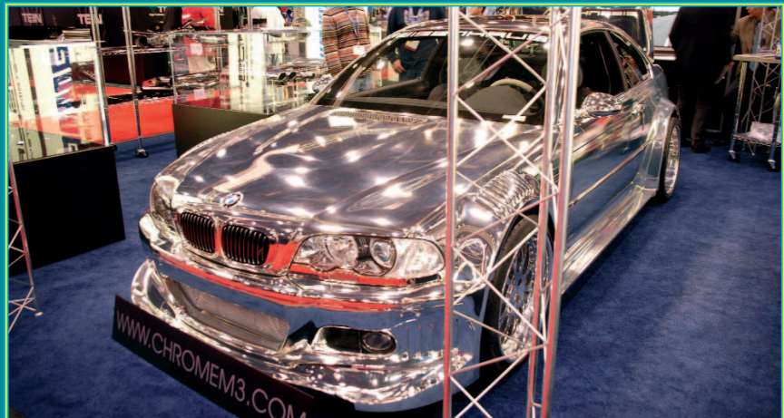
Spieglein, Spieglein auf dem Stand...