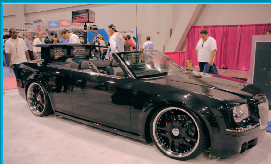
Pimp my ride: Chrysler 300 C von West Coast Customs