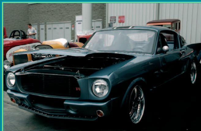
Der heißeste Mustang in Las Vegas