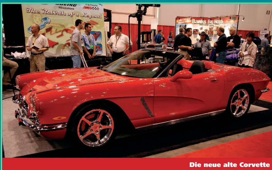
Die neue alte Corvette

In Sachen HiFi-Ausbauten gab es einiges mehr zu bestaunen wie in den Vorjahren. Der Trend geht zum Multimedia-Car. Besonders die renommierten Firmen waren mit ihren Sound- und Showfahrzeugen ein Publikumsmagnet. Ebenso vertreten waren zahlreiche Zubehörfirmen.