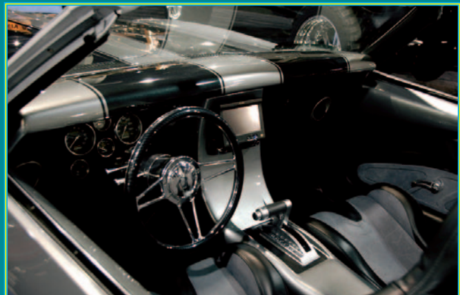
Multimedia im 67'er Camaro