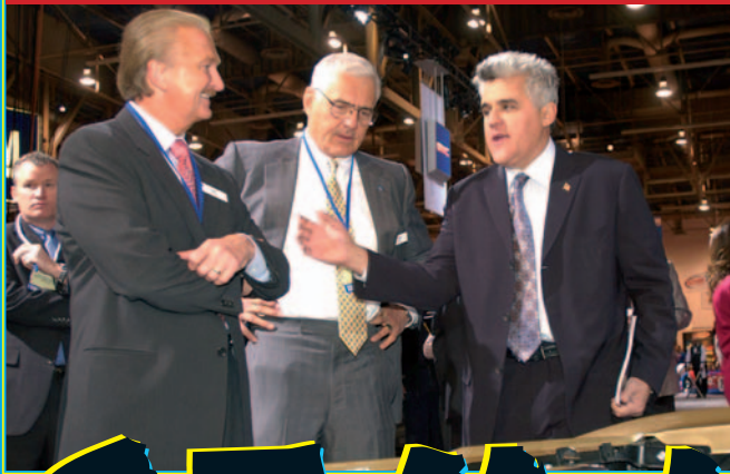
Benzingespräche mit Jay Leno